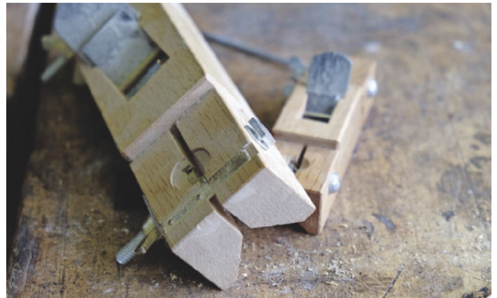
/ Kein Fräsen oder Schleifen: Sämtliche Kanten der Shoji-Türen werden mit einem japanischen Fasenhobel per Hand gebrochen.

blickt man hier über grüne Wiesen bis hin zu den stolzen, schneebedeckten Ausläufern der Chiemgauer Alpen.