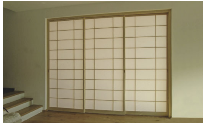
/ Subtil und symmetrisch: Auch bei größeren Flächen wirken japanische Shoji nie erdrückend, sondern immer luftig, leicht und elegant.

Eckverbindung des Rahmens erfolgt über Doppelzapfen, das kreuzweise überplattete Gitterwerk der Sprossen wird fugenlos eingestemmt. Nach oben hin werden die Türen in einer Holznut geführt, am Boden über eine Leiste aus Hartholz. Entweder klassisch japanisch „Holz auf Holz“ oder mittels eingelassenen Rollen in einer V-förmig eingefrästen Nut. Dort wo später rückseitig das Papier aufgeklebt wird, bringt er einen kaum sichtbaren Falz an, in den das Papier eingeklebt wird. Als Griffe, die natürlich bündig ausgeformt sein müssen, da die Türen später „voreinander“ laufen, fräst er entweder Griffmulden oder lässt einen Griff aus kontrastreichem Hartholz ein.