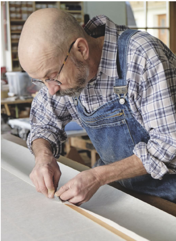
/ Nachdem das Papier mittels doppelseitigem Klebeband oder Reisleim aufgeklebt ist, wird der Überstand entlang des kaum sichtbaren Papierfalzes abgeschnitten.