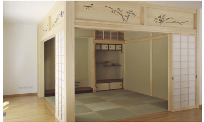
/ Shojis sind, sollte es mal nötig sein, große Verwandlungskünstler: Mit wenigen Handgriffen entsteht aus zwei kleinen Räumen ein großer.