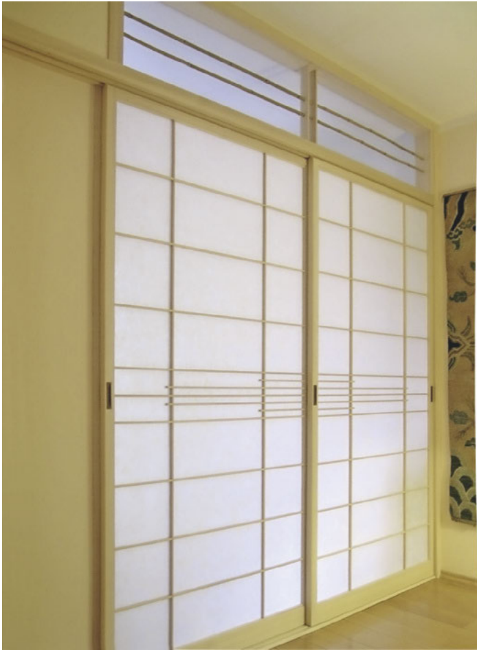
/ Eingebaute Shoji: Auch wenn sie den Blick in das Innere des Raumes versperren, so bleiben sie doch immer transluzent und durchlässig für Licht.